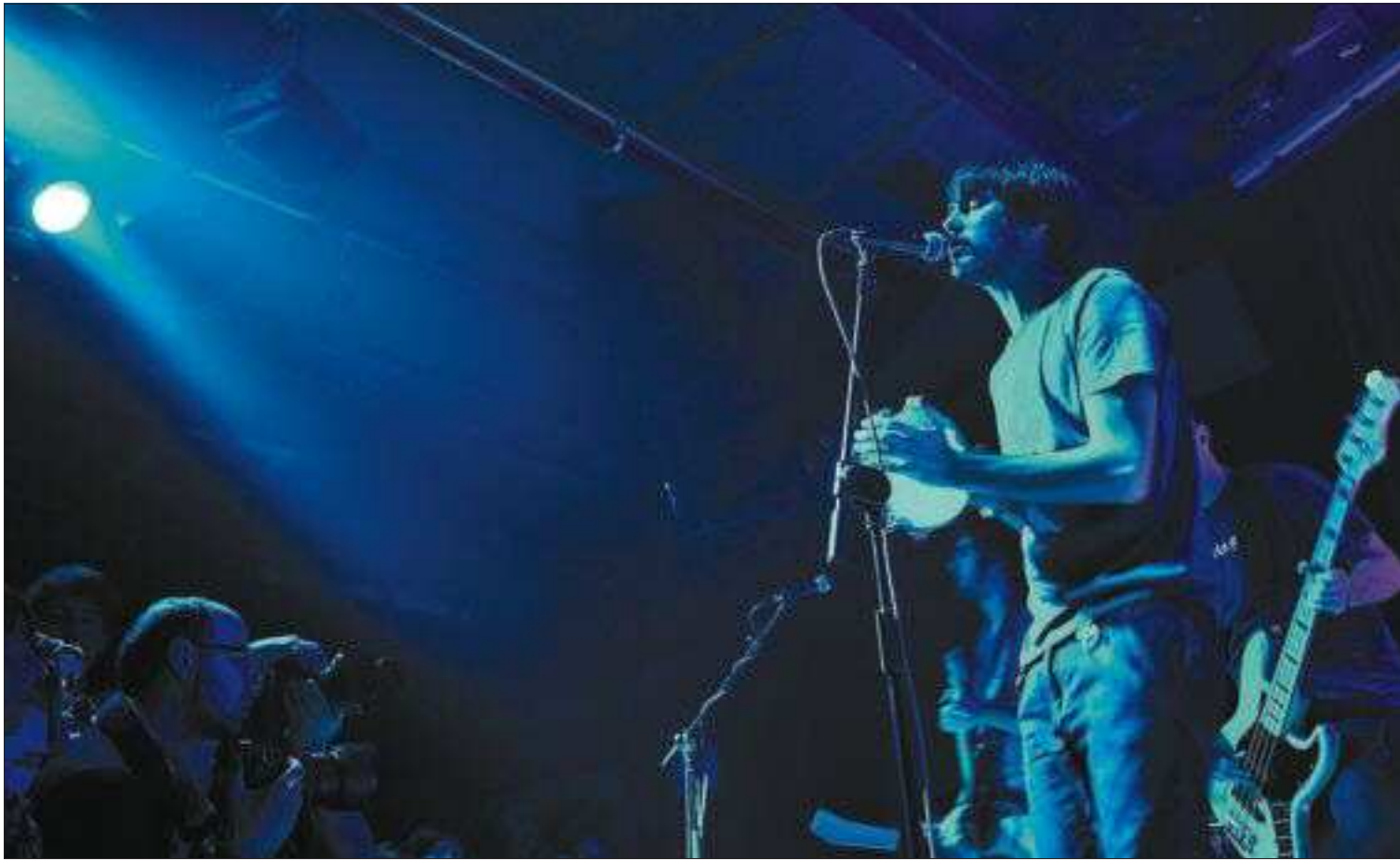
Recital de Vetusta Morla en la sala El Sol.