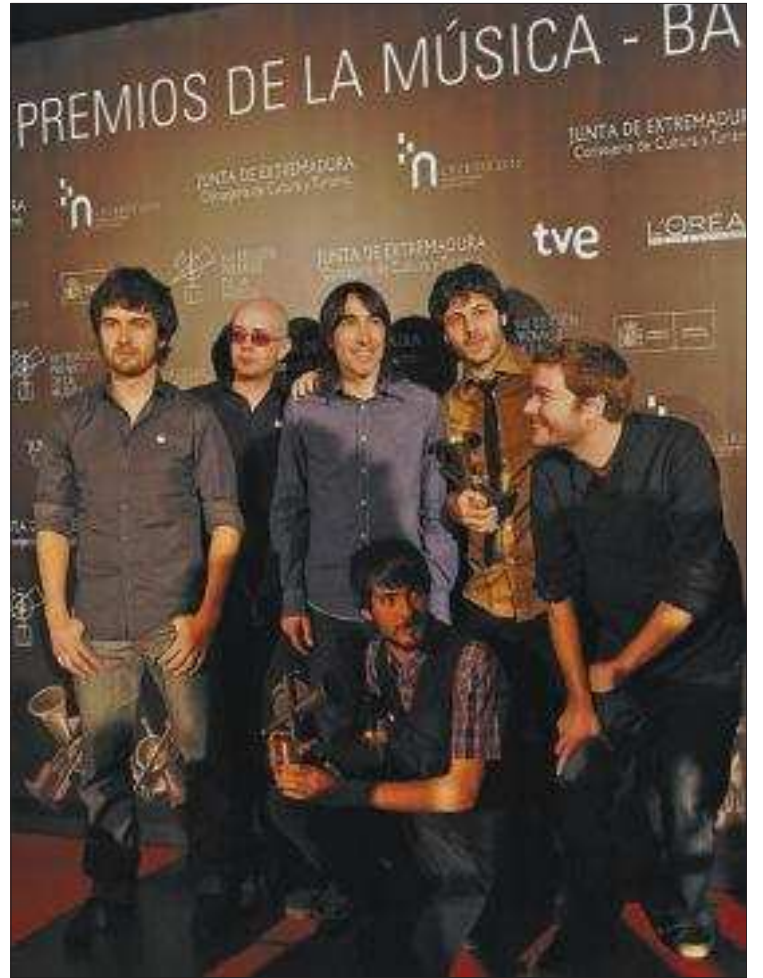
Los componentes de Vetusta Morla, anoche en Badajoz.