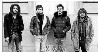
The Strokes ha dado en el clavo con su cuarto disco.