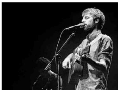
Manel fue toda una sorpresa en España.