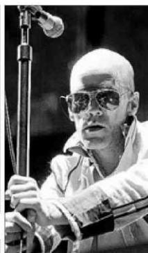
REM se separa. A la dcha., Rober, de Extremoduro.