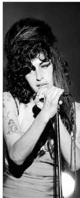
Amy Winehouse.