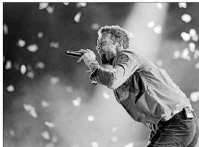
Coldplay ha consolidado su posición.