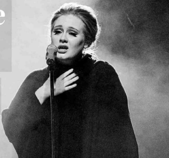
El segundo disco de Adele ha marcado un hito en la historia del pop y el soul británico.

La británica ha triunfado en un año que trajo los últimos discos de la historia de dos leyendas, REM y Amy Winehouse